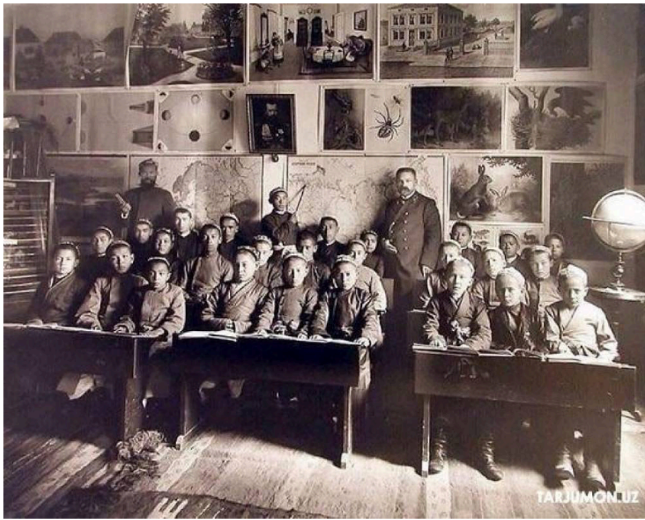
“Usuli jadid” – yangi maktab

ASOSIY QISM. Jadidchilik harakatining tub maqsad va mohiyatini, ular amalga oshirgan asosiy sa’y-harakatlarni o‘quvchilarga tushuntirish. (30 daqiqa)